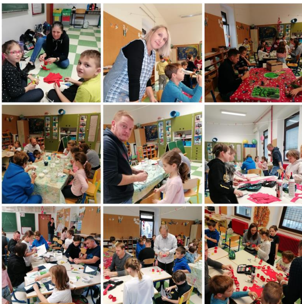
Primer sodelovanja s starši na TD, december 2023, 3.a

Koordinatorici Metodologije KZK sta način poučevanja vpeli v svoj pouk.