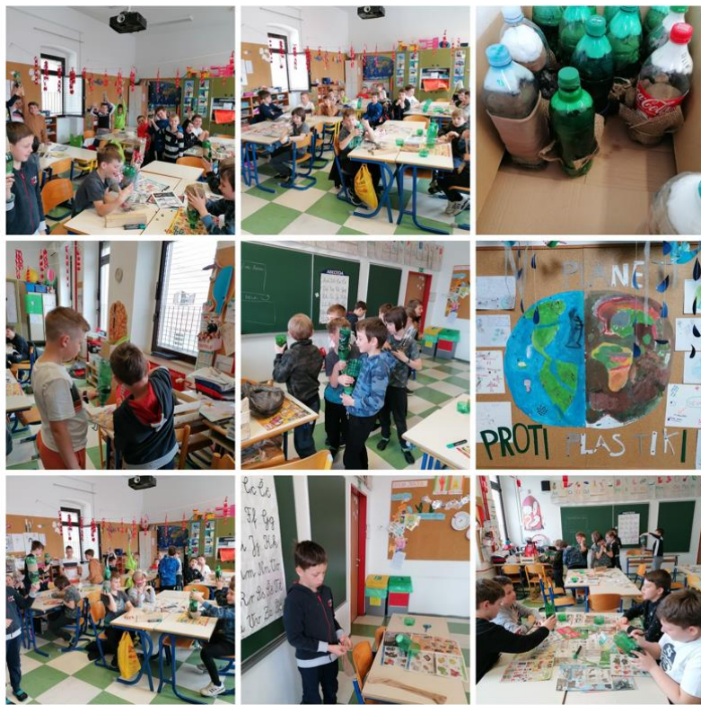
Izdelovanje vodnih filtrov